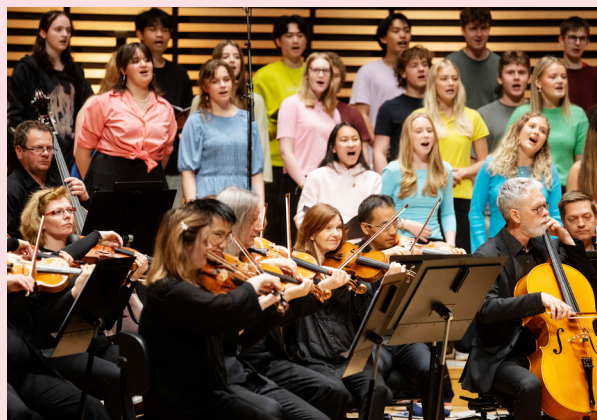
Kor fra Vågen videregående skole og musikere fra Stavanger Symfoniorkester